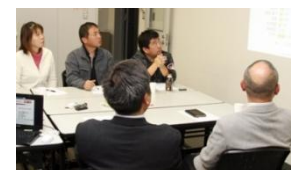
用務員による座談会をムービーでご紹介。 学校トイレに潜む問題点に迫ります。

子どもの成長と地域住民のために、トイレにできること。衛生管理、防災機能強化の視点でトイレづくりのポイントをご紹介します。