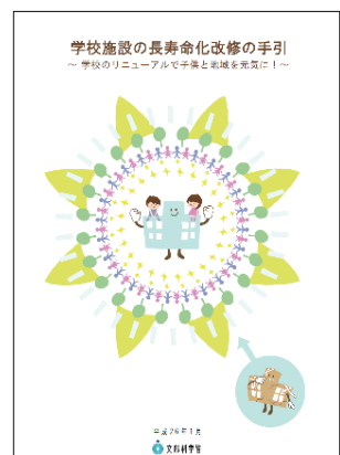
学校施設の長寿化改修の手引 (文部科学省 2014年1月)